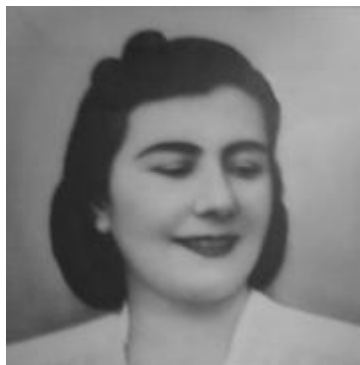
Μεγάλη Ευεργέτις της Ελληνικής Αντικαρκινικής Εταιρείας