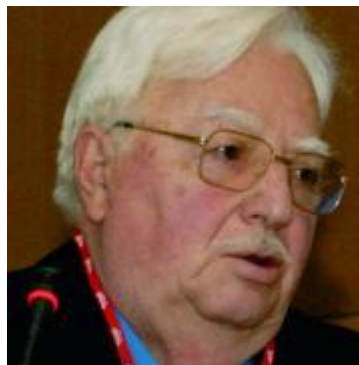
Καθηγητής Χειρουργικής Πανεπιστημίου Αθηνών, Πρόεδρος ΕΑΕ 1975-1984

Η ηγεσία και το Διοικητικό Συμβούλιο τής Ελληνικής Αντικαρκινικής Εταιρείας πάντοτε ήσαν αιρετοί και η πληθώρα τών άξιων στελεχών του προσέφερε νέα ορμή και δύναμη, πολλές νέες δραστηριότητες πρωτόγνωρες στον επιτελούμενο Αντικαρκινικό Αγώνα στην χώρα μας.