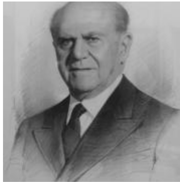
Ιδρυτής και πρώτος Γεν. Γραμματέας της Ελληνικής Αντικαρκινικής Εταιρείας 1958 – 1974