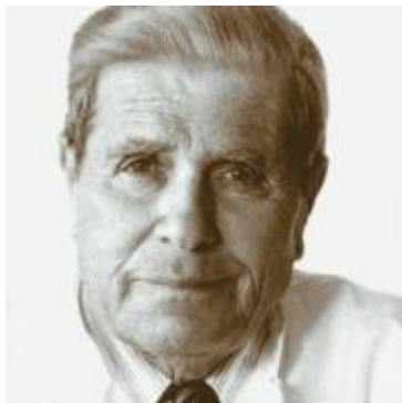
Ιδρυτής και πρώτος Πρόεδρος της Ελληνικής Αντικαρκινικής Εταιρείας 1958 – 1975