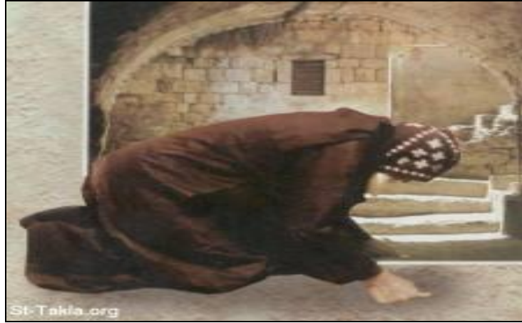
Εικόνα 1 Μοναχός της Κοπτικής εκκλησίας