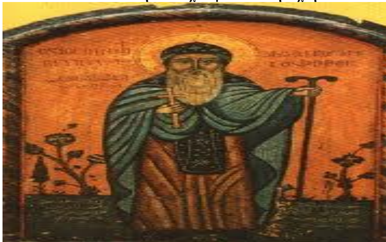
Εικόνα 4 Κοπτική εικόνα του αποστόλου Μάρκου