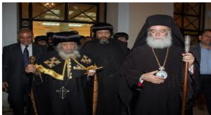
Εικόνα 7 Ο Κόπτης Πατριάρχης με τον Ελληνορθόδοξο Πατριάρχη της Αλεξανδρείας