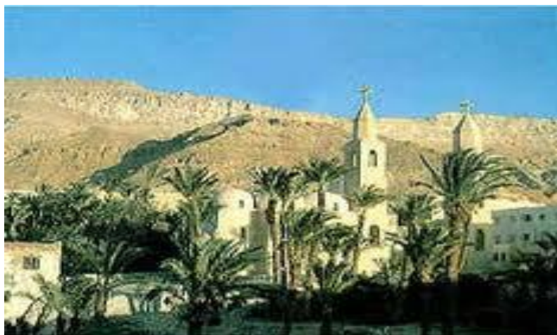
Εικόνα 5 Η Μονή του αγίου Αντωνίου στην Ερυθρά θάλασσα