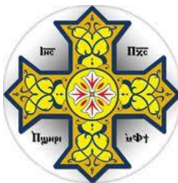
Εικόνα 8 Κόπτικος Σταυρός