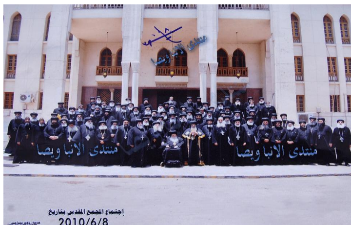
Εικόνα 6 Η Ιερά Σύνοδος της Κοπτικής Εκκλησίας, Στο μέσον ο Κόπτης Πατριάρχης Σενούτα ο 3 ος .