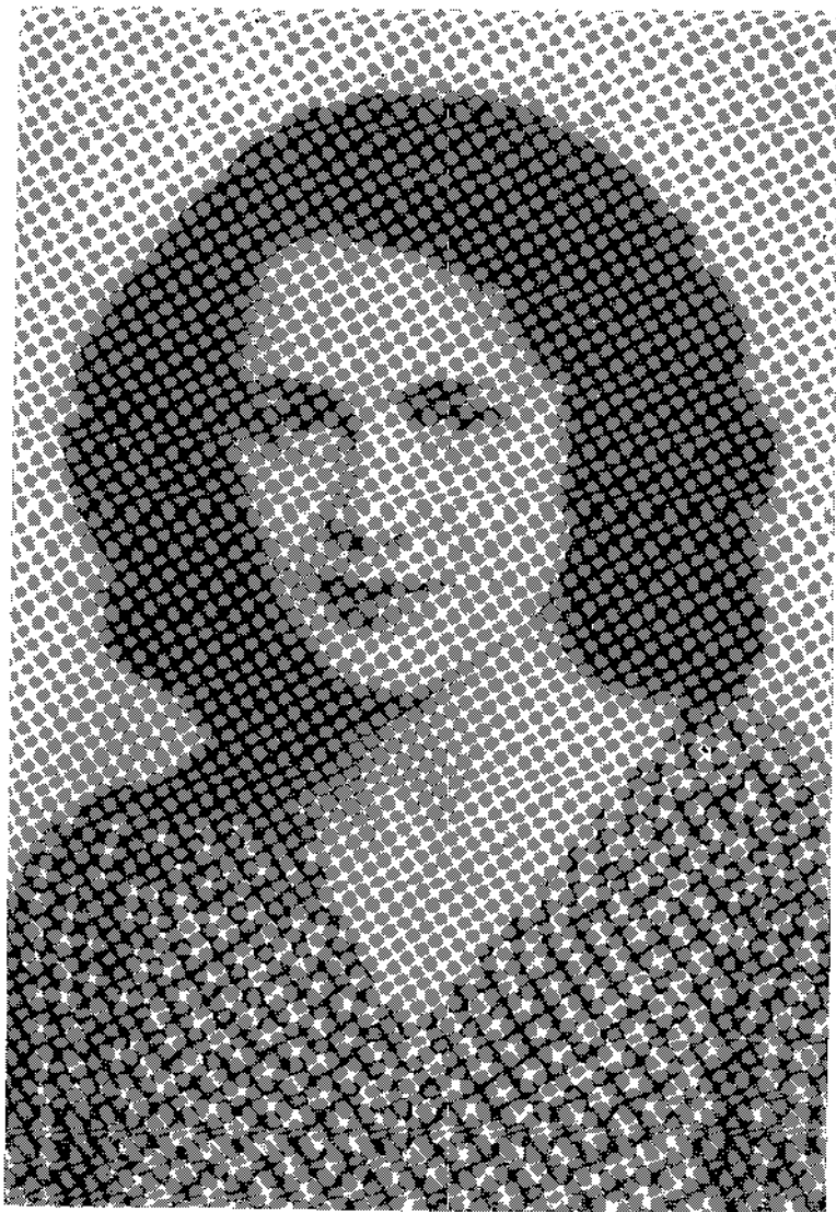
ΠΕΤΡΟΥΛΑ ΚΟΡΟΝΤΖΗ (1911 — 1967)